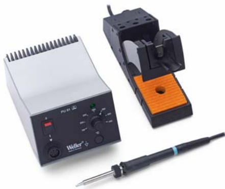
Lötstation WS 81T mit Lötspencil WSP 80 und Sicherheitsablage mit Stop & Go Funktion WDH 10T