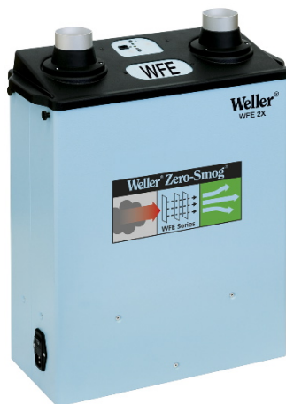
Neues tragbares Absauggerät WFE 2X reinigt die Luft an bis zu 2 Arbeitsplätzen